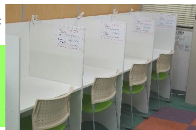
自習ブースの風景